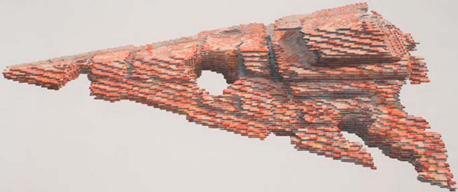
Los Carpinteros | Urbanizacion flotante | Aquarell auf Papier | 140 x 200 cm | 2012 | Courtesy Sammlung Funcke