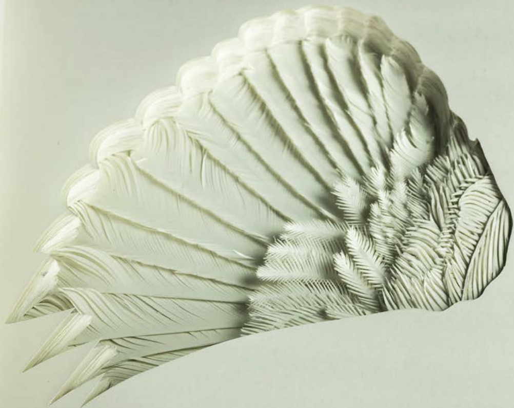
Sebastián Camacho | Migrantes 4 | Handausgeschnittenes Zeichenpapier | 22 x 45 cm | 2013 | Courtesy Sammlung Funcke