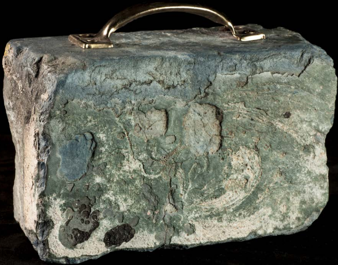
Karlo Andrei Ibarra | Desterrados | Pflasterstein aus der Kolonialzeit mit Metallgriff | 20 x 12 x 9 cm | 2015 | Courtesy Sammlung Funcke