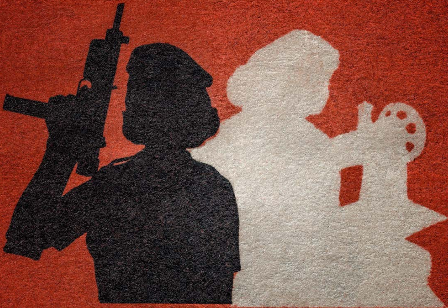
Adrián Fernández | Standard No. 2 | Digitalfotografie auf Alu-Dibond | 100 x 100 cm | 2014 | Courtesy Sammlung Funcke