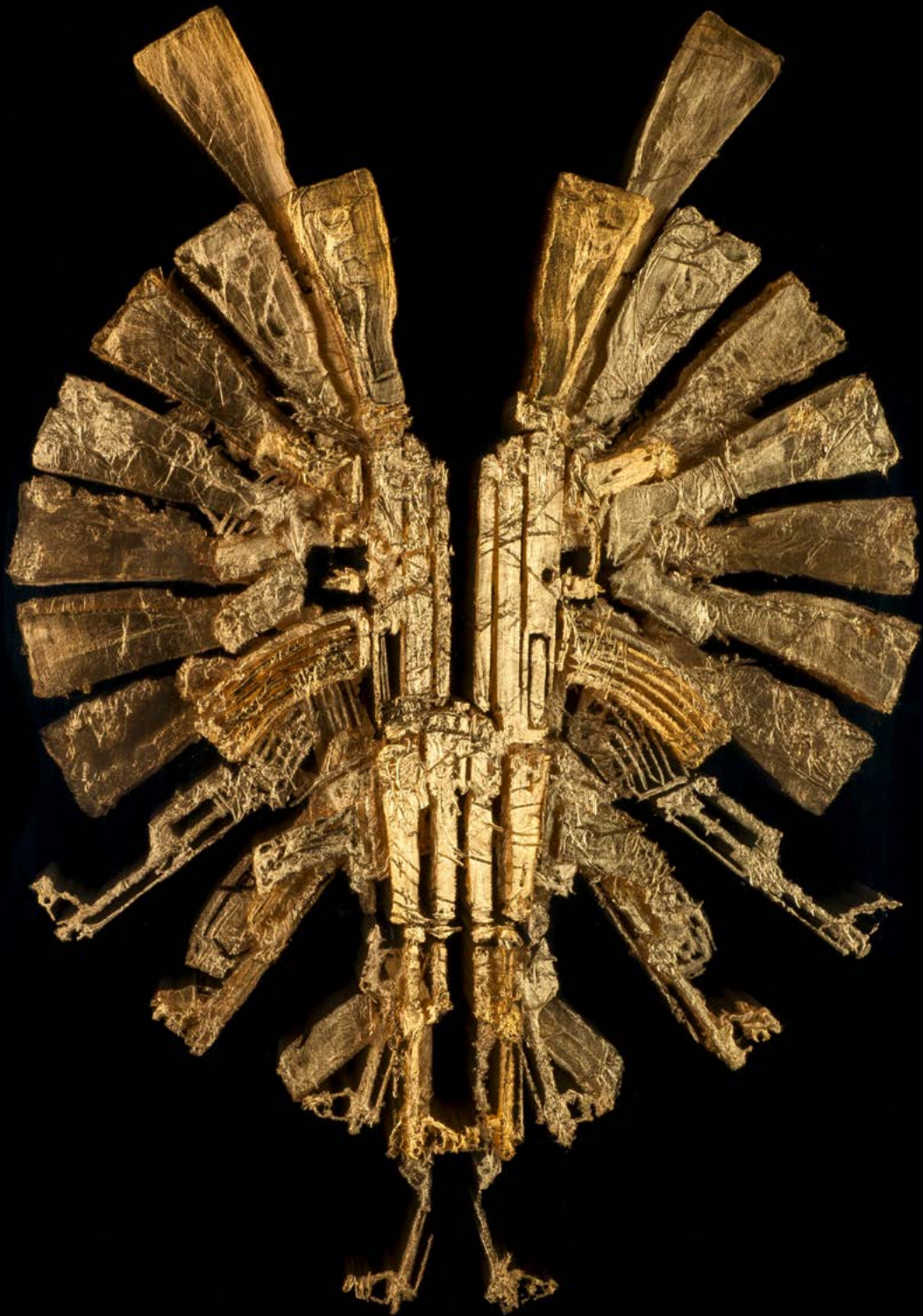
Yosman Botero | Postcolombino #3 | Goldfolie auf Acrylplatten | 51 x 52 x 7 cm | 2015